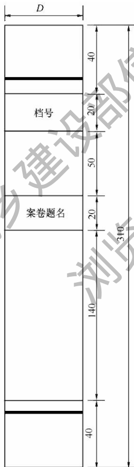
图 F 案卷脊背式样