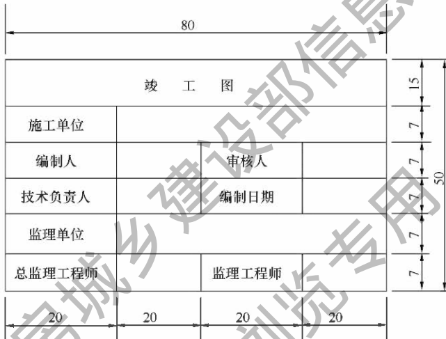
图 4.2.8 竣工图章示例

1 竣工图章的基本内容应包括：“竣工图”字样、施工单位、编制人、审核人、技术负责人、编制日期、监理单位、现场监理、总监。